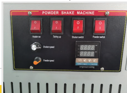
PANNELLO DI CONTROLLO FORNO