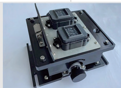
CAPPING STATION IN ALLUMINIO