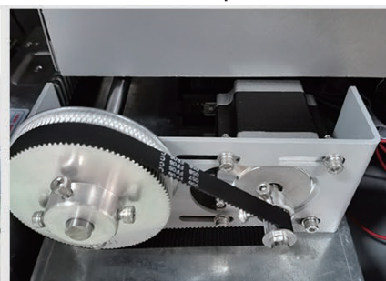
MOTORI DI ALTA QUALITA'