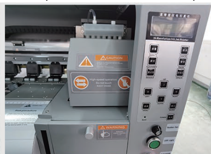
PANNELLO DI CONTROLLO STAMPANTE